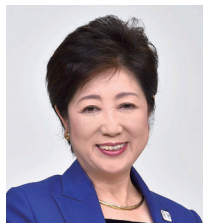
東京都知事 小池 百合子 Yuriko Koike