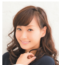
タレント 藤本 美貴 Miki Fujimoto

災害から自分や大切な人を守るためには、一人ひとりが災害について知り、日頃からどう備えるかを考えるとともに、地域でともに支え合うことが必要です。「家族」と「地域」のために、災害から身を守るため「今」できる備えを、一緒に考えてみませんか? 皆さまの参加をお待ちしています!